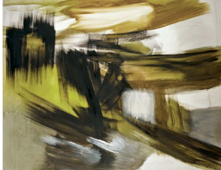
Dezember 63, 1963, Öl auf Leinwand, 135 x 170 cm December 63, 1963, oil on canvas, 135 x 170 cm

Multifaceted in its painting technique and formal qualities, Fritz Winter's oeuvre stands in a tradition committed equally to the art of Der Blaue Reiter and the Bauhaus. With his largely non-figurative formal language, he sought a superior connection to nature in order to make visible the elemental forces and structures underpinning all creation: 'It requires much greater faith and much greater skill to make the invisible visible in free form than to attest to the visible and tangible simply as they are.'