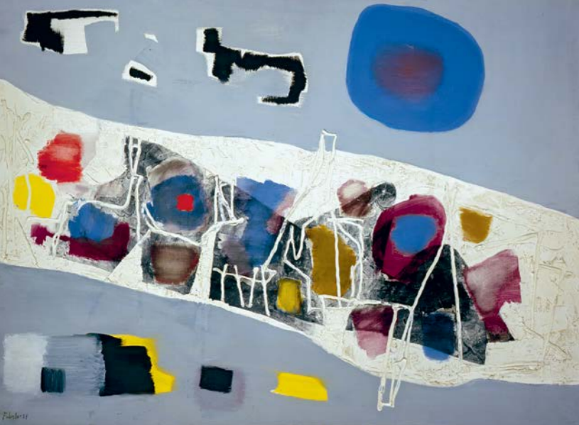
Weißer Weg, 1957, Öl auf Leinwand, 90 x 130 cm White Way, 1957, oil on canvas, 97 x 130 cm