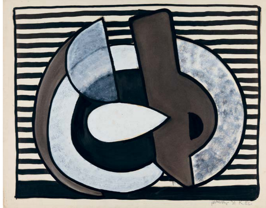
K. EL., 1931, Öl und Gouache auf Karton, 64,8 x 81,7 cm