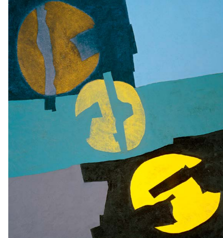
In drei Zonen, 1968, Öl auf Leinwand, 145 x 135 cm In Three Zones, 1968, oil on canvas, 145 x 135 cm

Fritz-Winter-Stiftung Bayerische Staatsgemäldesammlungen Barer Straße 29 D-80799 München www.fritz-winter-stiftung.de www.pinakothek.de